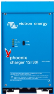
Phoenix charger 12V 30A