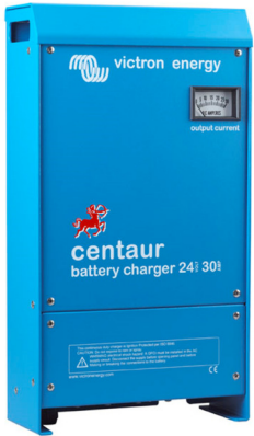
Centaur Ladegerät 24 30